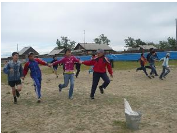
Укрепление здоровья учащихся