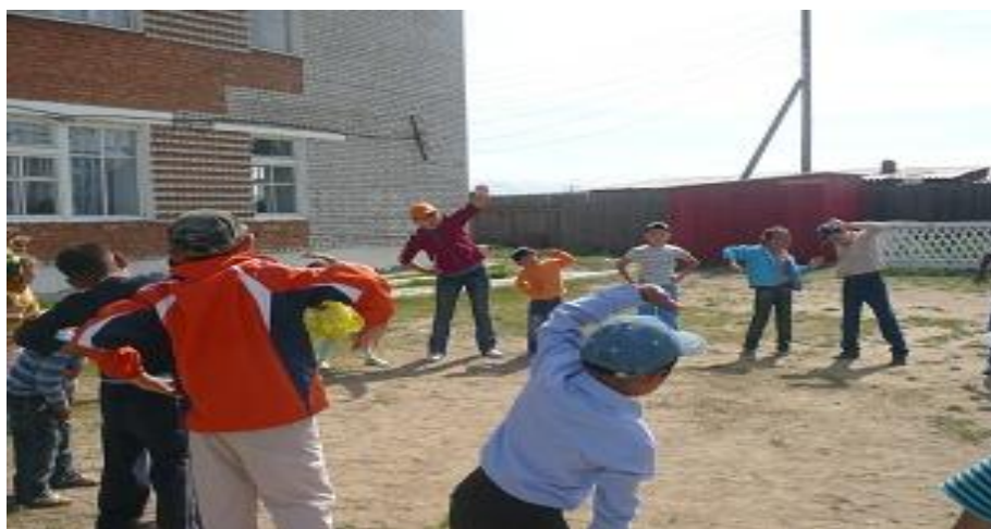
А). Показатели по детскому травматизму во время учебного процесса