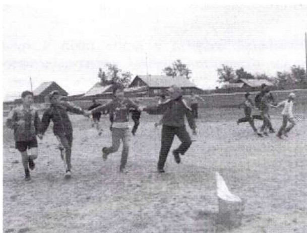
Укрепление здоровья учащихся