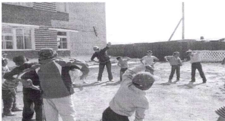
А). Показатели по детскому травматизму во время учебного процесса